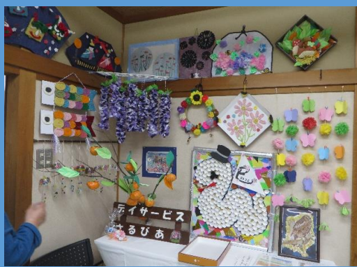
さるびあの展示作品